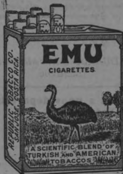
50 cajetillas vacías para una acción para el Concurso

Debido a la ley No. 192 que crea un recargo de diez céntimos por paquete en el Impuesto de Consumo, nos vemos obligados a aumentar el precio del paquete es decir de ochenta a noventa céntimos para mantener la alta calidad que siempre han tenido los cigarrillos EMU. La ley entró en vigencia el 8 de Setiembre y después de esta fecha los paquetes llevan los nuevos marbetes y el precio impreso en el paquete.